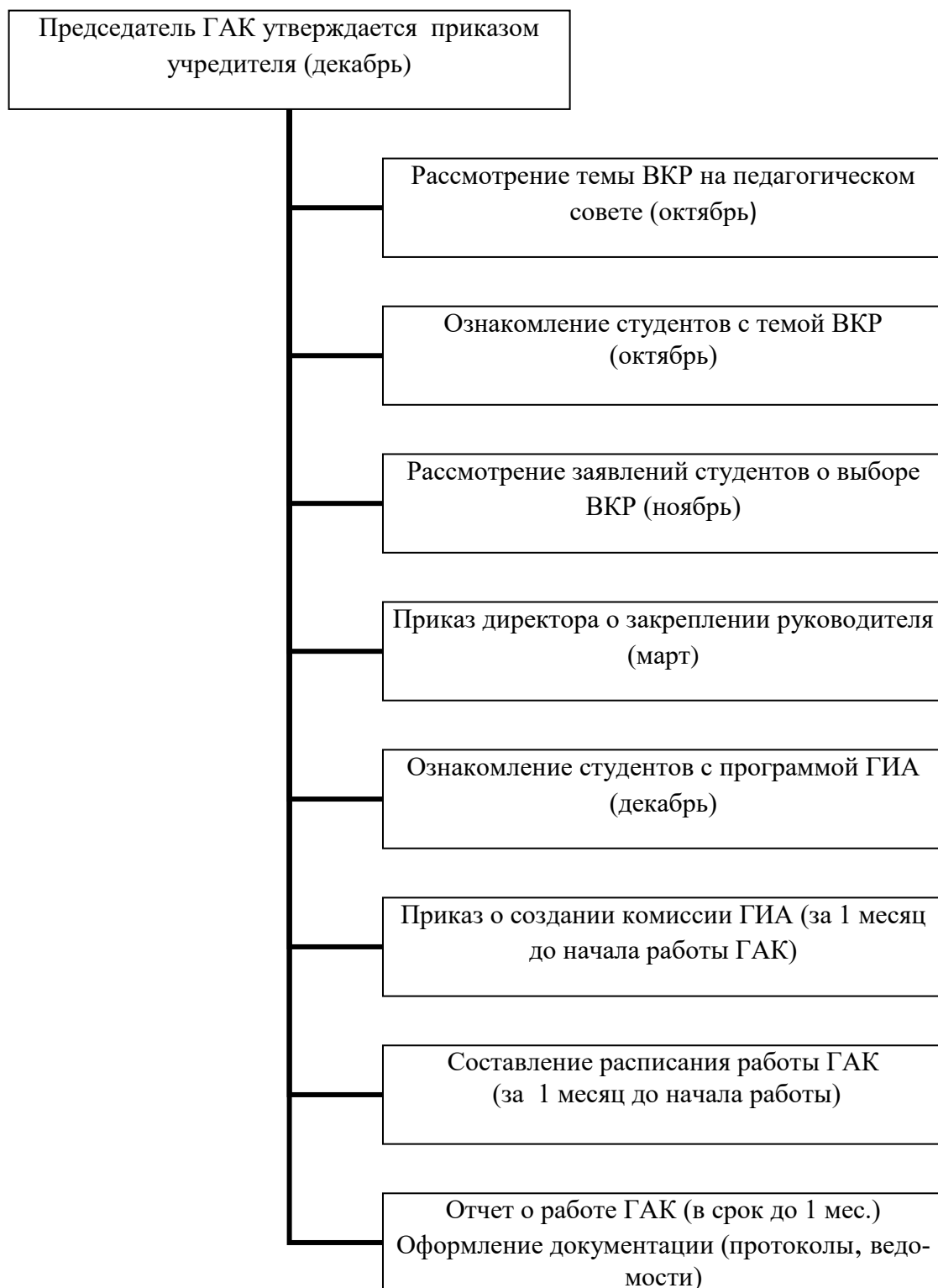
Схема организации и проведения ГИА